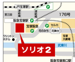
最寄駅 阪急宝塚駅(直結)